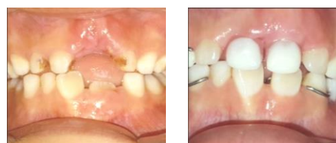
Fig. 7. Resultado final, con la colocación de la aparatología ortopédica funcional