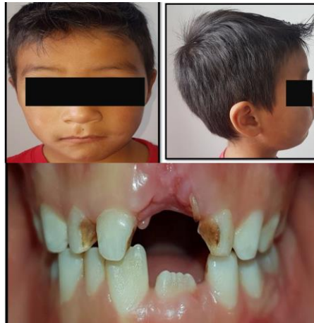
Fig. 1. Fotografías extraorales e intraorales de nuestro paciente, al iniciar el tratamiento. Fig. 2. Fotografías intraorales de nuestro paciente al inicio del tratamiento.

heredofamiliares de ninguna índole. Se refiere un paciente aparentemente sano. Al examen clínico extraoral, el paciente no presenta patología actual. Al examen clínico intraoral el paciente presentó dentición mixta, escalón mesial exagerado, caninos sin desgaste fisiológico, acumulación de placa dentobacteriana, múltiples caries dentales, presentación de restauraciones provisionales en óxido de zinc y eugenol, acompañado de restos radiculares. Figura 1-2